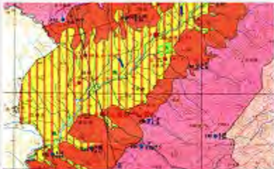
图 10-1-1 长江流域水资源分布图