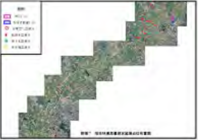
附圖 7 檳榔林區地籍調查成果圖