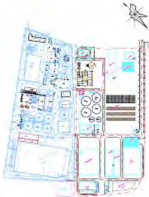
附图1 项目平面布置图