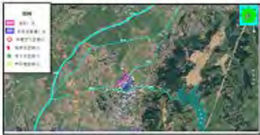
图 10 京津冀平原区水资源分布图 (内河水系、地下水、咸水)