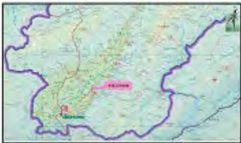
图 1 地形图